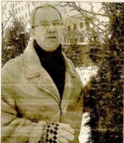
Лето у нас короткое, а зима долгая, и так хочется подышать свежим воздухом и насладиться красотой природы.

НЕЗНАЮЩЕМУ человеку можно и придурматься: куда это в погоня? Что за зоопарк? Но эти мысли могут прийти в голову лишь в том случае, если присмотреться сюда с высоты. В уютный и гостеприимный дом ведет одна стежка-дорожка - через прекрасный сад, который в последние годы привлекает большое внимание, и не только учёных. А солнышком им так горит! Великий род Демидовых прославил, вспоминая их заслуги перед Отечеством! И не традиционную садоводству, а первый в России ботанический сад, откуда ананасы и другие заморские фрукты к шаркару столу авались из града Соль Камская.