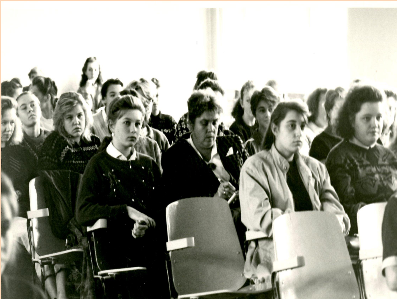
Студенты Соликамского педагогического института первого набора, 1991 год. Фотофонд. Д. 5161