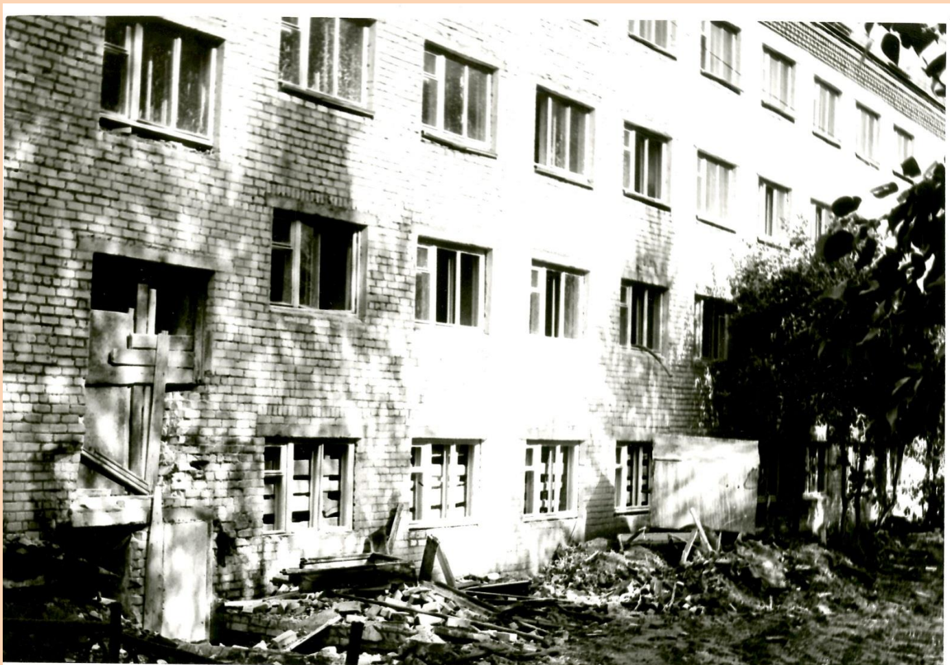
Общий вид строящегося здания Соликамского пединститута, 1991 год. Фотофонд. Д.5173.

6 апреля 1991 года вышло Постановление Совета Министров РСФСР №191 «Об организации Соликамского государственного педагогического института».