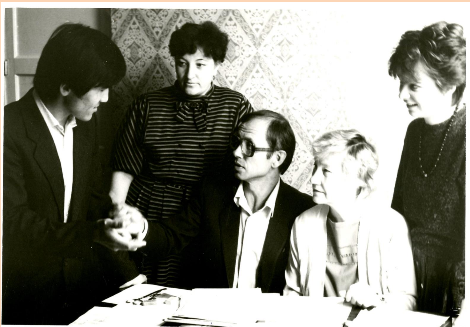
Члены приемной комиссии Соликамского пединститута во время экзаменов, 1991 год. Фотограф: Т. Рыковская/МБУ «Архив СГО». Фотофонд. Д. 5160.