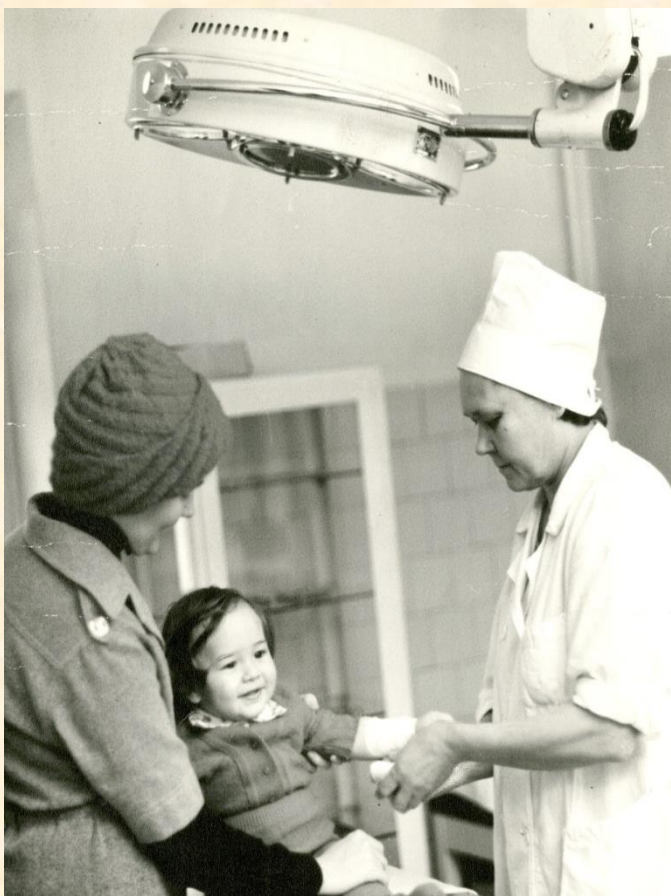
Копия. 1983 год. В хирургическом отделении детской поликлиники. Автор: А Новожилов.