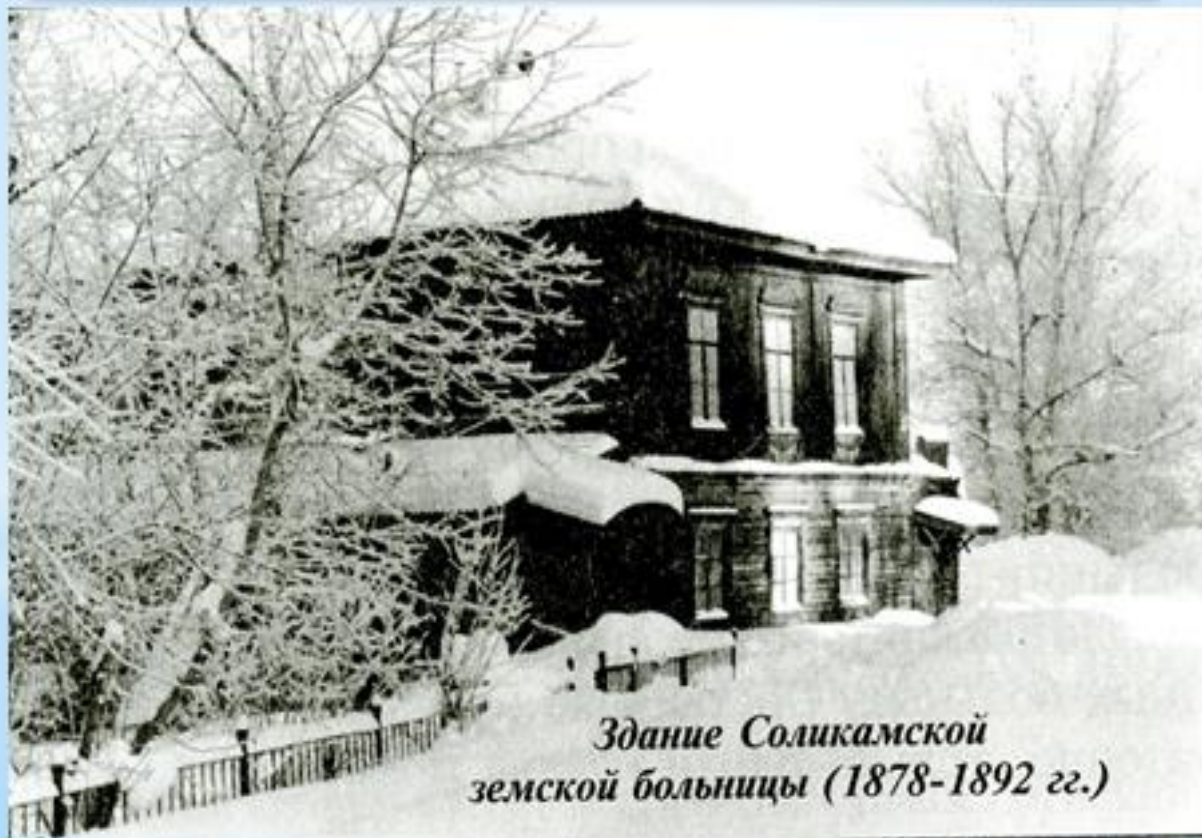
Здание Соликамской земской больницы (1878-1892 гг.)

Соликамское земство было открыто в мае 1870 года. Им было принято в свое ведение от приказа общественного призрения только одна больница на весь уезд в г.Соликамске, не имеющая ни постоянного врача, ни аптеки.