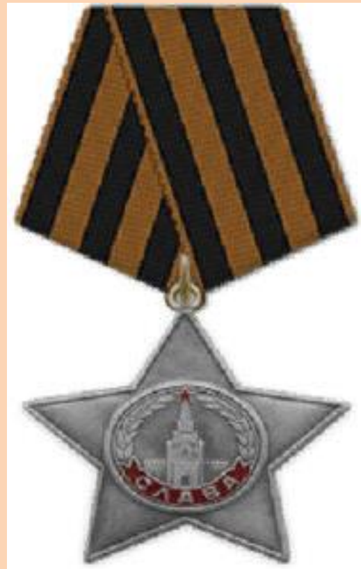
Орден Славы III степени (приказ №: 105/н от: 19.09.1944г.)