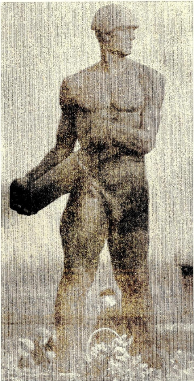
На снимке: памятник Н. Ладкину.