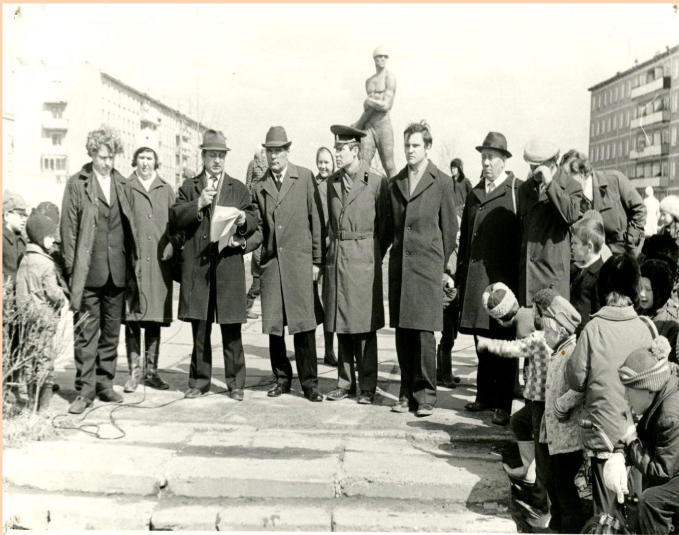
Копия. 1979 год. Открытие автопробега, посвященного 34-ой годовщине Дня Победы, у памятника Н. Ладкину. Основание: фотофонд, №618