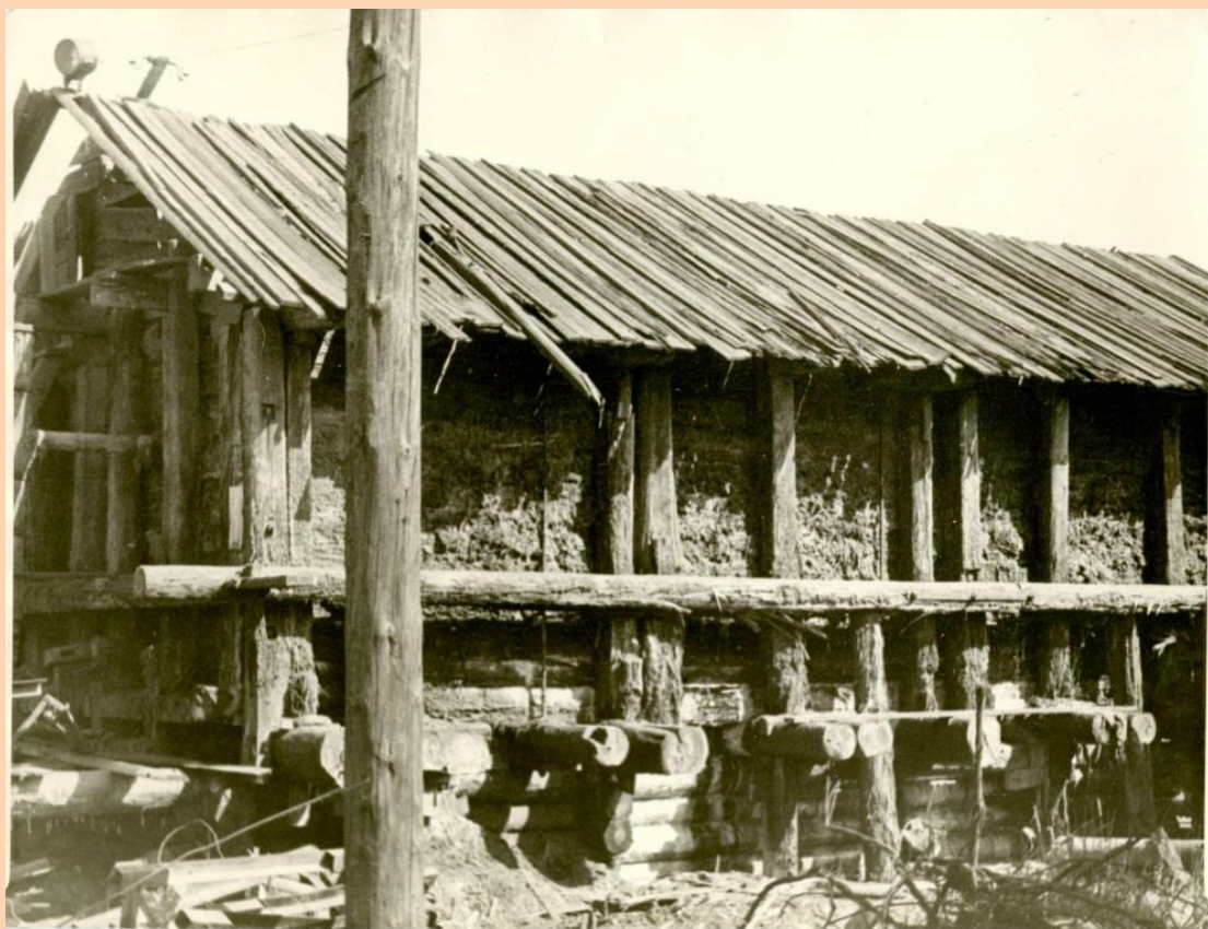
Копия. 1982 год. Общий вид уникального памятника старины – Усть-Боровского сользавода Основание: фотофонд, №1294

О герое СССР рассказывает внучатая племянница.