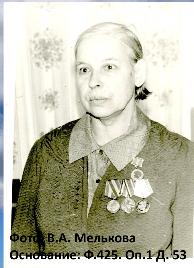
Основание: Ф.425. Оп.1 Д. 53

Звание «Почетный гражданин Соликамского района» присвоено в июне 2002 года