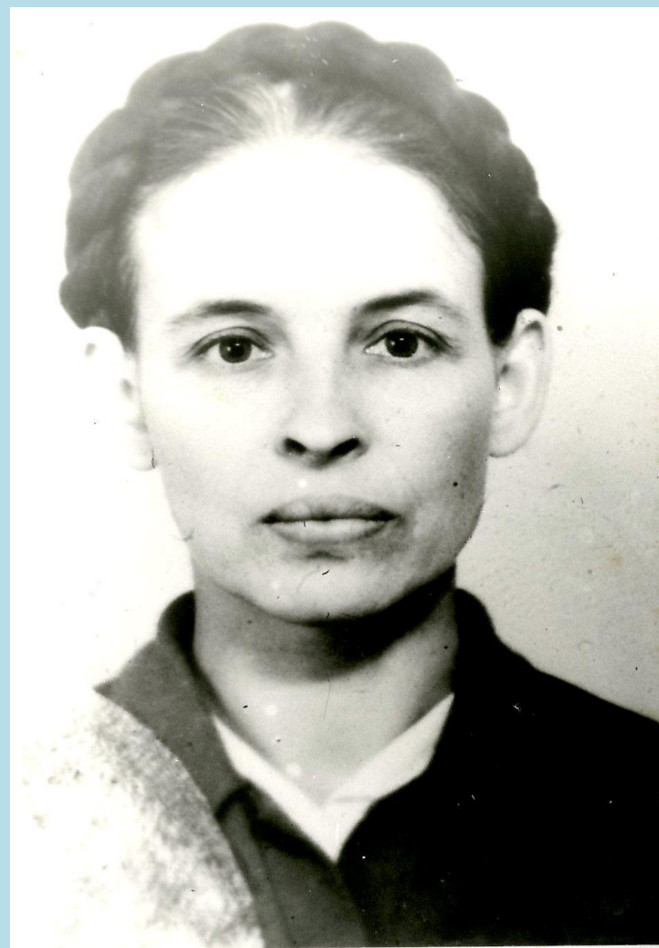
Фото. В.А. Мелькова. 1971 год. Основание: Ф.425. Оп.1 Д.48

Из исторической справки к личному фонду В.А. Мельковой Ф-425 МБУ «Архив СГО»