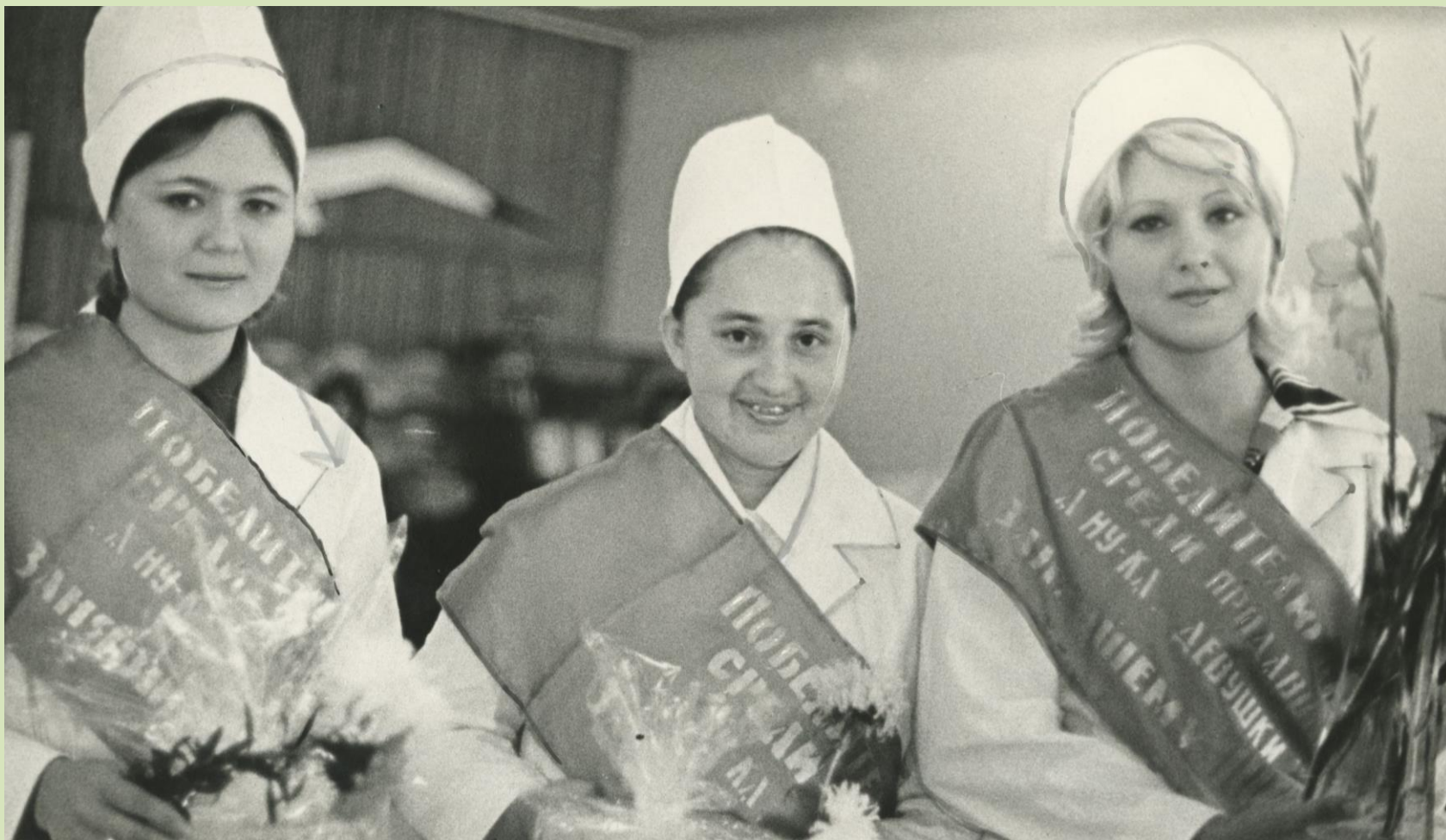
Копия. 1976 год. Победители городского конкурса среди продавцов «А ну-ка девушки».