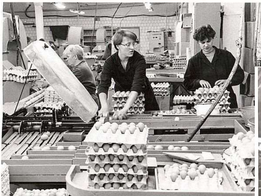
В яйцесортировочном цехе ОАО «Родниковская птицефабрика», 1997 год. Фотофонд. Оп. 58. Д. 352