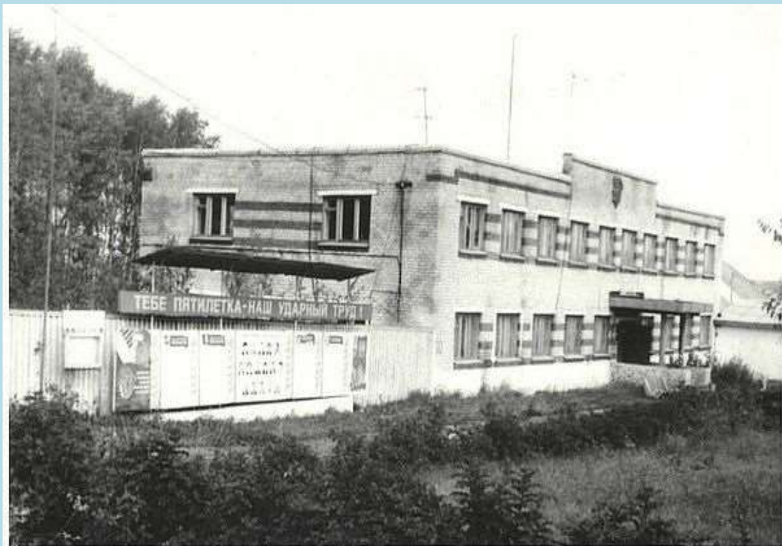
Здание управления птицефабрики в с. Родники, 1986 г. Фотофонд. Оп. 58. Д. 316