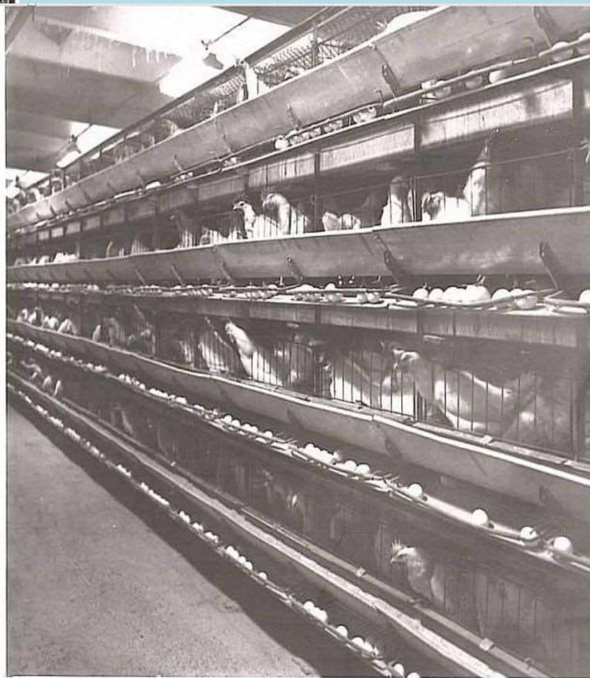
Клетки с курами-несушками на птицефабрике «Соликамска», 1986 год. Фотофонд. Оп. 58. Д. 318