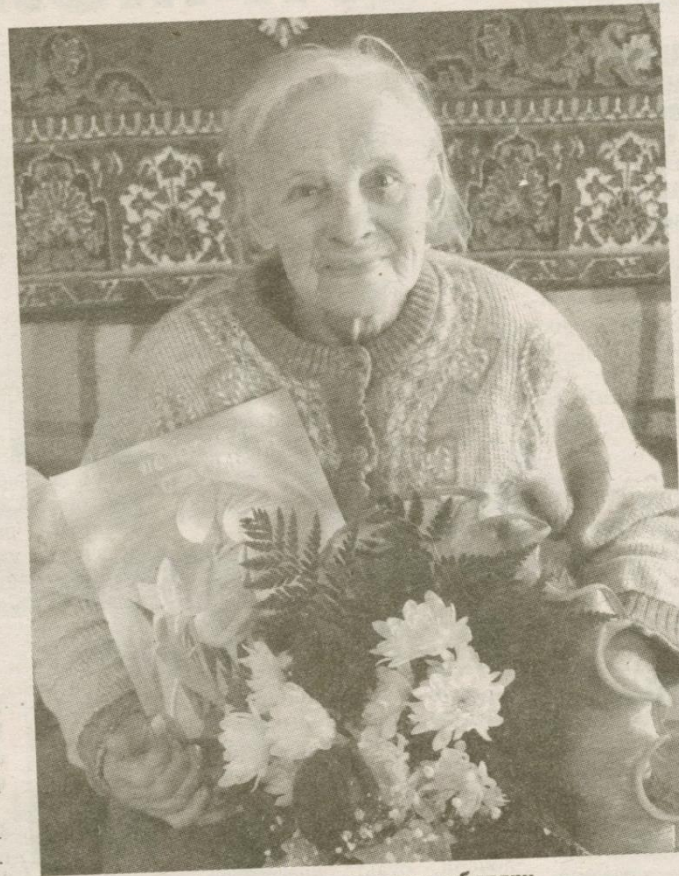
Цветы и поздравления – почетному юбиляру.