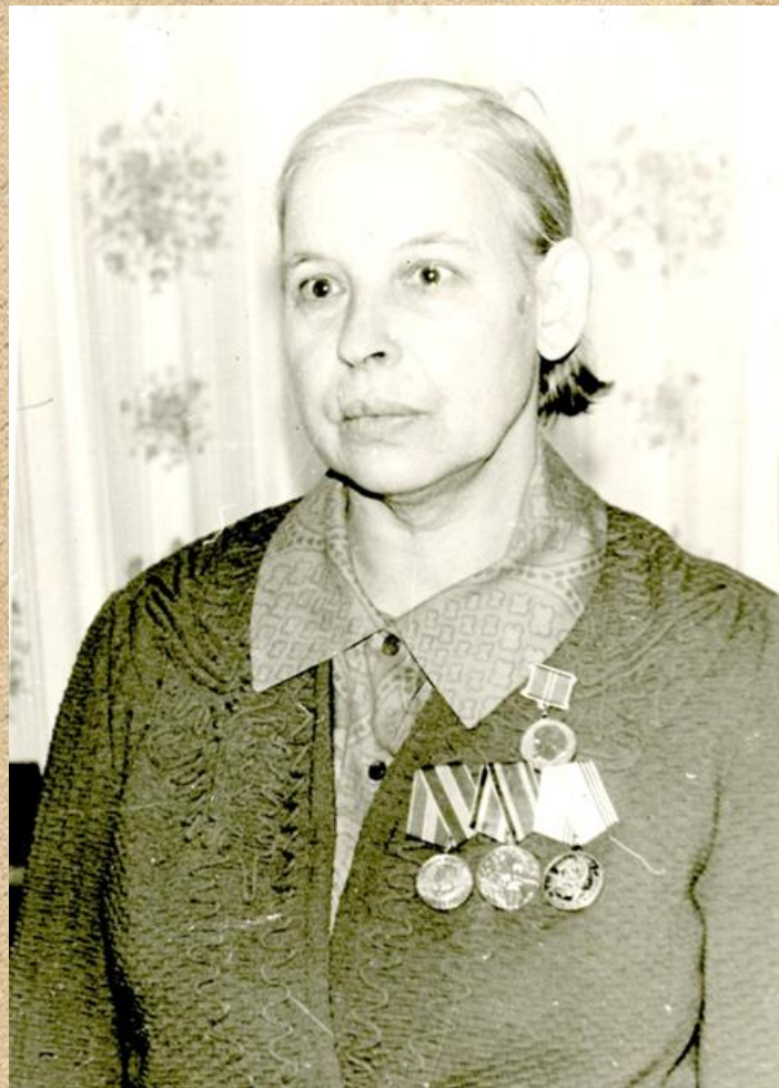
Фото. В.А. Мелькова Основание: Ф.425. Оп.1 Д. 53