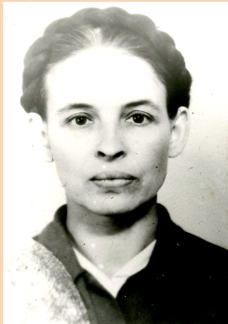
Фото. В.А. Мелькова. 1971 год. Основание: Ф.425. Оп.1 Д.48

Из исторической справки к личному фонду В.А. Мельковой Ф-425 МБУ «Архив СГО»